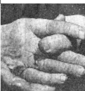
Ľudská ruka je mapa, ktorú kreslí život.