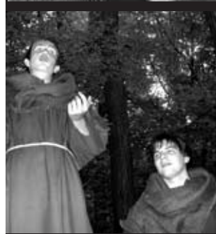
Zábery z tohtoročných Povestí hradného kastelána.