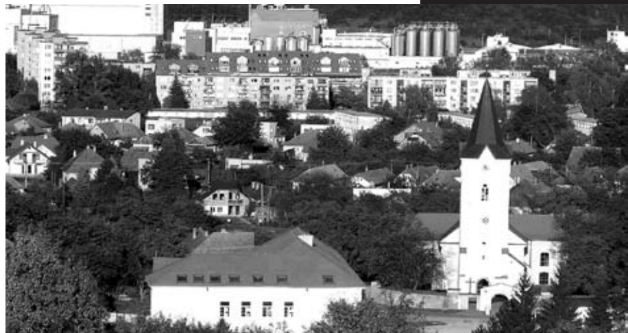
Veľký Šariš - naše mesto.