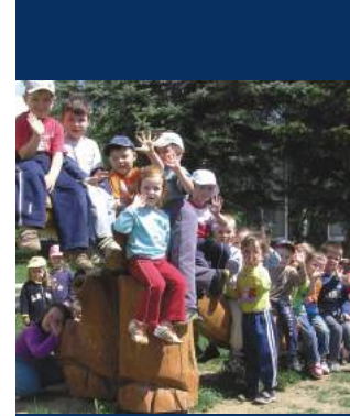
Zábery z detských ihrísk