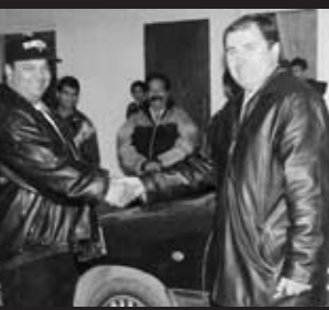
Dnes sa nám býva lepšie, ďakujeme pán primátor!