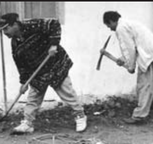
Vlastná práca Rómov, pri riešení ich bytových problémov môže byť vzorom aj pre ďalšie komunity v našom kraji.