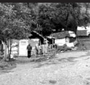
Bývanie rómskej komunity vo Veľkom Šariši pred niekoľkými rokmi.