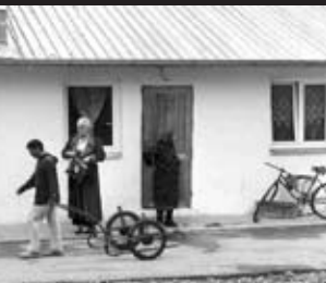
40 bytových jednotiek pre rómske rodiny vo Veľkom Šariši, vyriešilo najväčší problém rómskej komunity v našom mestečku.